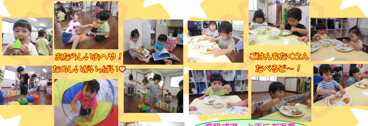
あたらしいおへや！